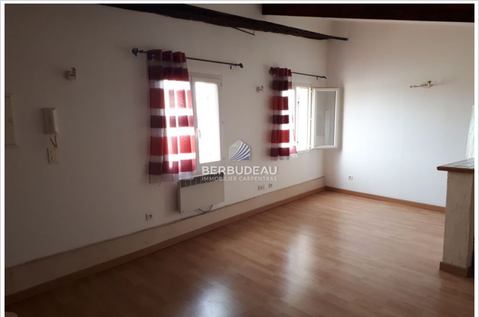
Appartement 884 Carpentras